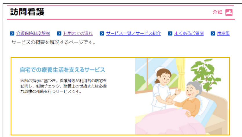
WAM NET 介護サービス「訪問介護」のページ